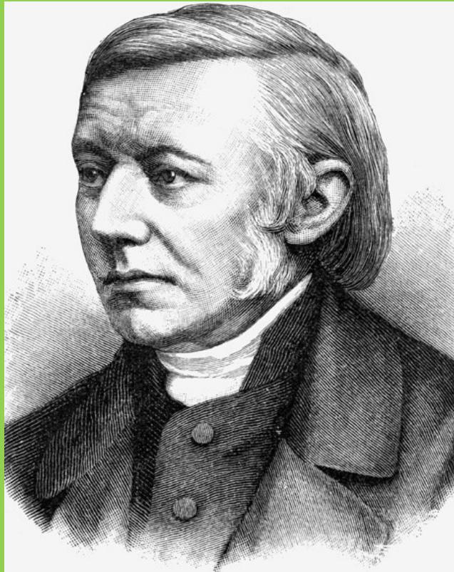
Theodor Fliedner: gründete 1836 eine evangelische Pflegeschule und die Diakonissenanstalt in Kaiserswerth bei Düsseldorf